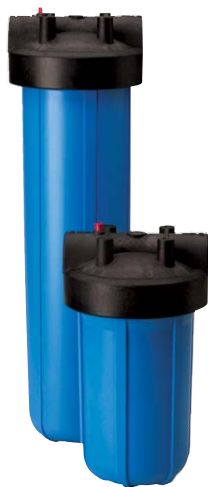
No se muestra Big Black

PARA APLICACIONES DE GRAN CAPACIDAD Y ALTO FLUJO